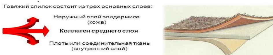
Рисунок 1 - Спилоч (коллаген среднего слоя)